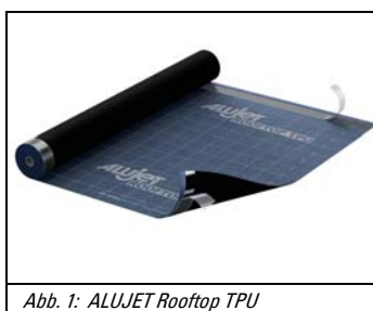
Abb. 1: ALUJET Rooftop TPU