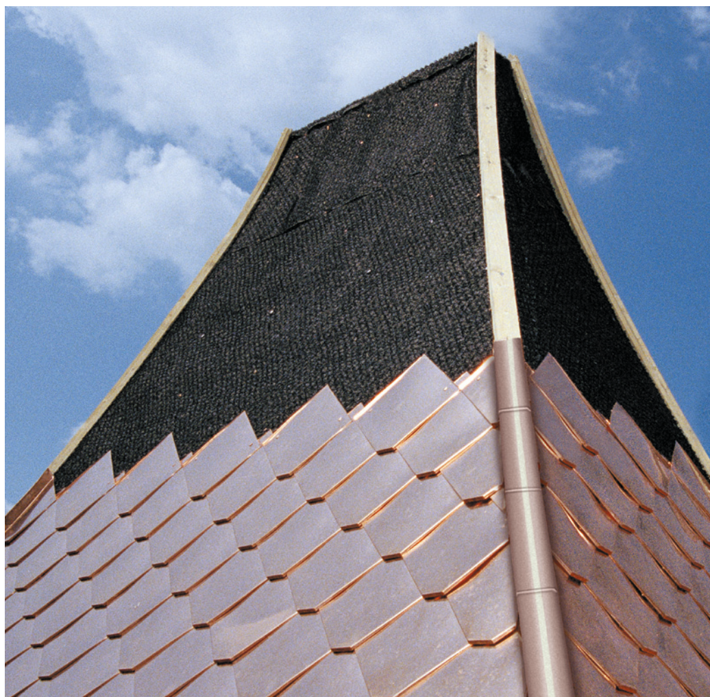
DELTA®-TRELA PLUS ist die optimale Trennlage für hochwertige Metaldächer.